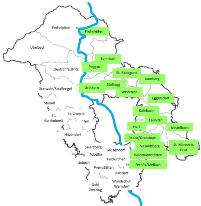
Abb.2: eigene Darstellung